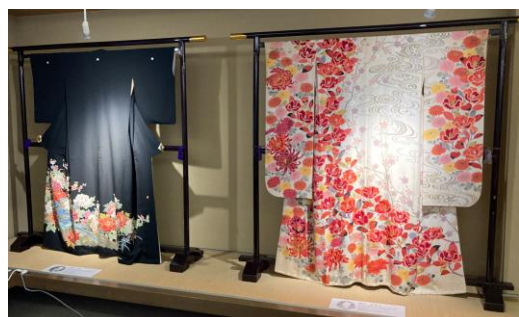
特別展示室「昭和の巨匠展」